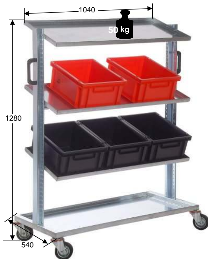
Art.-Nr.: 5390.1210.01 Ablagengröße: 925 x 405 mm Eigengewicht: 41 kg

Art.-Nr.: 5390.12102 Ablageboden einzeln